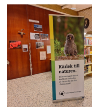
Delar av skogsutställningen i Färila

Februari-april Gävleborgs skogsutställning besöker Färila bibliotek.