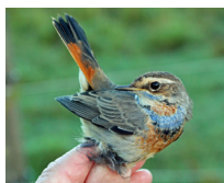
Blåhake vid Lindängets fältstation, Orsa

josephine.linder.stojsic@studieframjandet.se