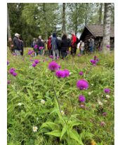
Brudborste under fjolårets ängsvandring, foto: Paul Kolk

29 juni kl. 14, Erik Lars väg 3, Åsmundshyttan - Ängsvandring hos Lage Bergström från kretsstyrelsen!