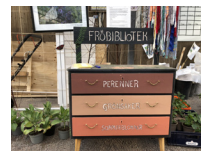
Fröbyrå i Haga trädgårdar