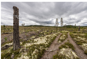
Kalhygge i Dalarna

Ett led i detta är att pausa tryckt Gävle-Dala Natur. Den har krävt mycket resurser i form av papper (skog), pengar och arbetstid. Vi är den enda regionen som haft ett tryckt medlemsblad och det ligger inte i fas med den digitala utvecklingen i samhället i övrigt.