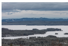
Vy över Rogsjön

Kika gärna in på kretsens Facebook- och hemsida för mer information som kommer när aktiviteterna närmar sig.