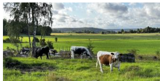
Kor i Rävbacken

https://mora.naturskyddsforeningen.se/2024/09/13/invigningen-efter-3-manaders-arbete-av-3-ar/