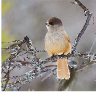
Lavskrika