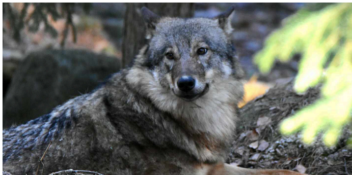
Varg i park.

Rovdjurskonferensen för samexistens, som WWF och Naturskyddsföreningen arrangerade, hölls i tre dagar i Järvsö. Totalt deltog 250 personer, på plats eller digitalt, och lyssnade in 32 talare och paneldeltagare, allt under skicklig moderering av PO Tidholm. Det var mycket lyckade dagar med nöjda deltagare och stor mediabevakning. På Naturskyddsföreningen Gävleborgs webb kan du läsa en mer personlig betraktelse.