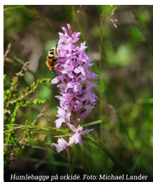
Humlebagge på orkidé.

16/6 HOFORS De Vilda Blommornas Dag vid Fäbods naturreservat i Östansjö, Torsåker. Barbro Risberg guidar. Samling Lidl kl. 10 eller Torsåkers blomsterhandel kl. 10.15. Ta med dig fika. Behöver du skjuts, ring Barbro, 076-138 29 00.