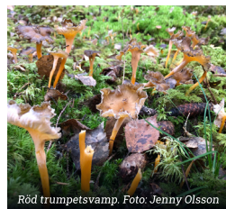
Röd trumpetsvamp.