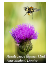
Humlebagge jämnar klint.

16/6 GÄVLE Vilda blommornas dag-vandring i Hemlingby kl. 10–14. Blomstervandring med lite grundläggande botanik. Samling vid spårcentralen i Hemlingby kl. 10. Medtag fika och kläder efter väder. https://devildablommornasdag.se/home