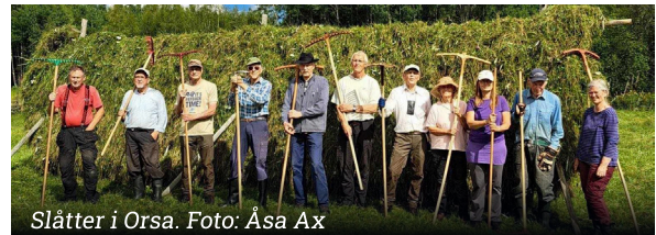
Slätter i Orsa.

Slättern börjar kl. 8.00 alla dagar. Vi håller på fyra timmar. Vi bjuds på fin gemenskap samt frukost kl. 9.30 varje slätterdag. Du är välkommen även om du inte kan komma exakt på klockslaget!