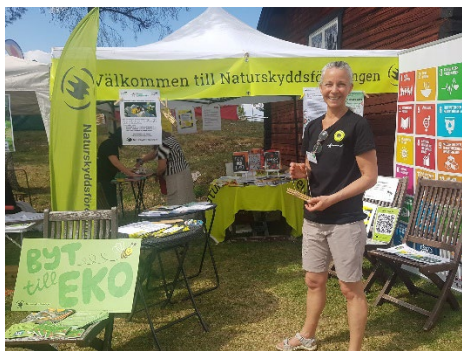
Trädgårdsmässa, tema Rädda bina