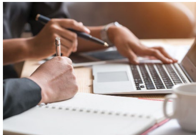
Studiecirkel i kommunikation