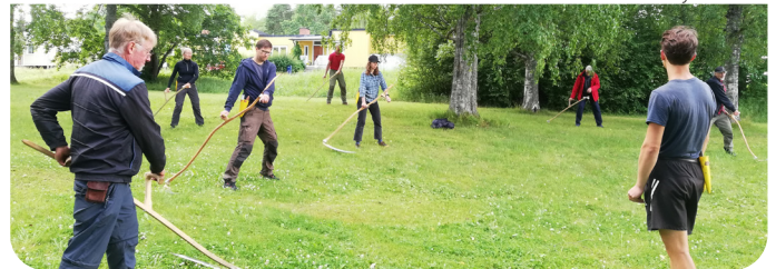
Lyckad knackliekurs med Slättergubben den 7 juli i Gävle, läs mer på länsförbundets hemsida.