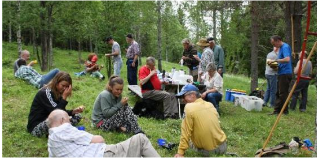
Slätterfika – inte att förglömma ☺

https://gavleborg-lan.naturskyddsforeningen.se/wp-content/uploads/sites/184/2022/05/Slatter-2022-kretsangar-Naturskyddsforeningen-Gavleborg.pdf