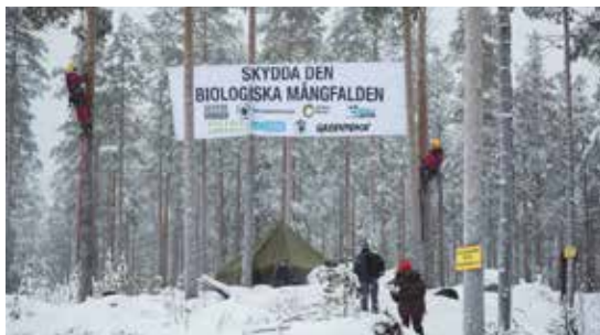
Ore Skogsrike.

Som en aptitretare ordnar vi en bussutflykt dagen innan skogskonferensen. Mer info och anmälan via länken nedan.