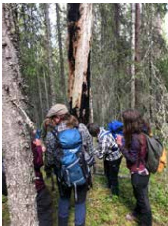
Basti guidade med den äran i Ljusdal.

Sammanfattningsvis var allt väldigt lyckat och kom inte bara skogsintresserade från Gävleborg till gagn.