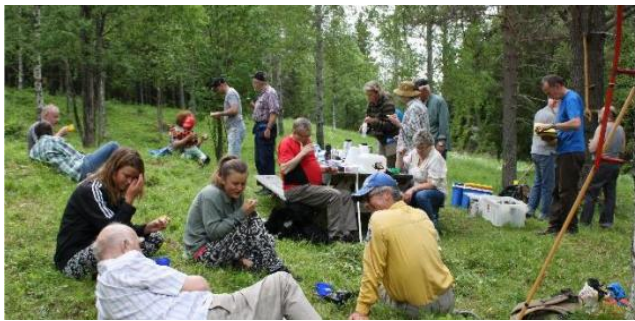
Slätterfika – inte att förglömma ☺

https://gavleborg-lan.naturskyddsforeningen.se/wp-content/uploads/sites/184/2022/05/Slatter-2022-kretsangar-Naturskyddsforeningen-Gavleborg.pdf