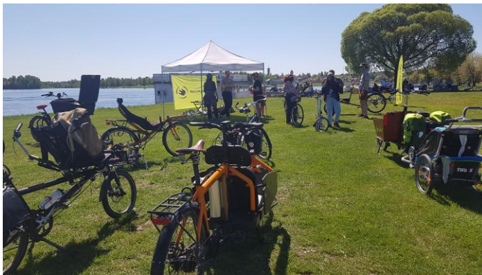
Cykelinspiration i Mora