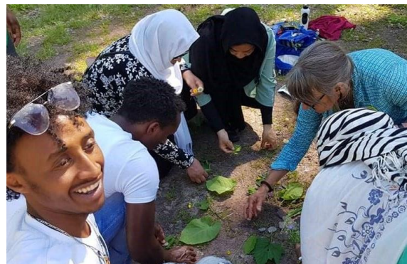
..... och bygger en tavla av natursaker i Mora.