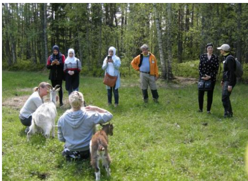
Friluftskompisar hälsar på getter i Falun.....

Läs mer på https://dalarna.naturskyddsforeningen.se/ och FB Friluftskompis Dalarna.