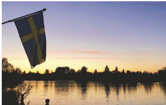
Kväll vid Västerdalälven. Bredvid den svenska flaggan kunde också en FN-flagga ha hängt.

Men hur står det till i länet för alla innevanare som inte räkar vara människor? I våra släppte Artdatabanken en ny rödlista, där hotade djur och växter räknas upp. Dalarnas ornitologer, skogsvandrare, svampkännare och mycket annat har läst denna rödlista med lupp. I en rad artiklar kommer aktiva i olika föreningar att skriva om tillståndet för den