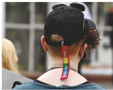
Black lives-matterdemonstration i Sverige.

Det är som om en väldig förbannad och progressiv opinion till slut måste fram och inte går att stoppa, trots den pandemi som begränsar möjligheten att demonstrera. När en svensk polis, en kvinna, i en situation under en demonstration, föll på knä och solidariserade