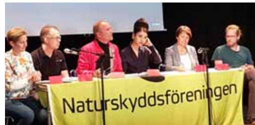
Politisk utfrågning inför EU-valet.