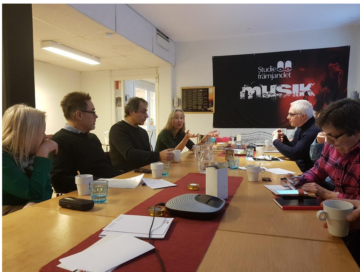
Några av deltagarna