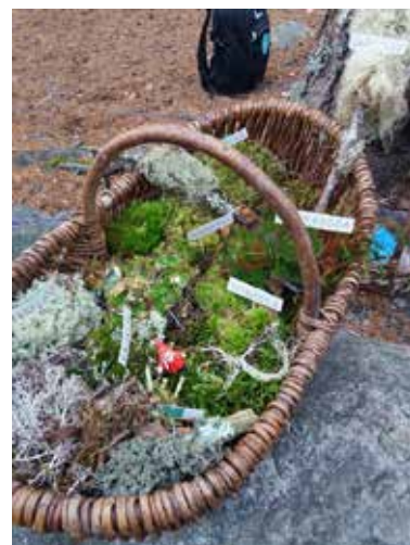
Vacker mosskorg på en annan Natursnoksaktivitet i Falun.