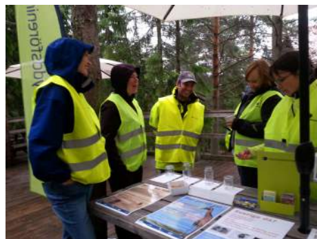
Glada volontärer informerade i parken.