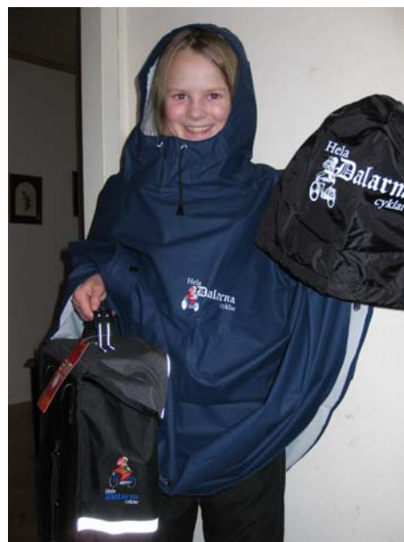
Modell med priser med Hela Dalarna cyklar-loggan: regncape, cykelväska, hjälmlås och mjuk reflex.