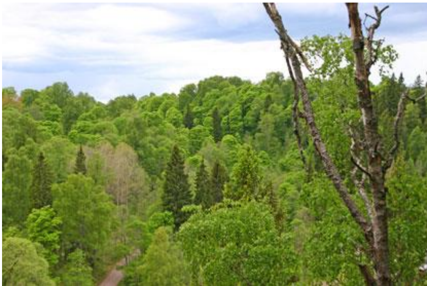
Säterdalens gröna, lummiga skog med mest lövträd.