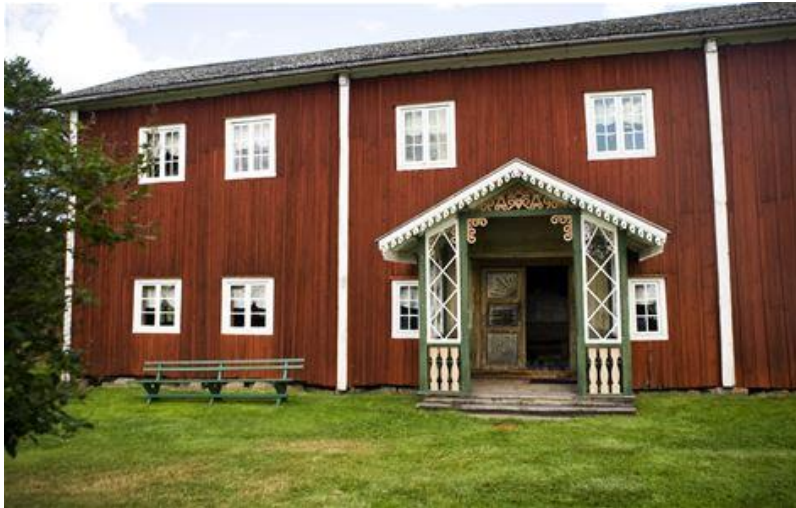
Gammalgården i Fågelsjö

Det går bra att ansluta till bussrutten var du vill, Gävle till Falun t ex. Från Gävleborg rekommenderar vi annars samåkning i egna bilar. Deltagarlista som underlättar samåkning mailas ut efter 15 augusti.