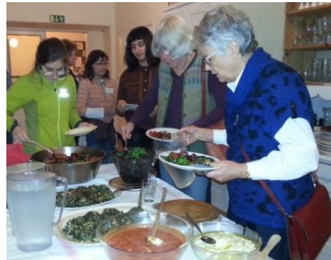
Mycket god, vegetarisk mat på Lindsberg.

Det kom upp idéer till studiecirkel om tillsammansodling i Rättvik, introduktion till svensk natur för nyanlända, att stärka nuvarande skogs nätverk/skogsgrupp genom kurser i avverkningsanmälningar och digitala kartor, naturvårdskurs för markägare, bevara våra rovdjur, jord- och skogsbruk i nya former, inventera ekofrisörer, peppa butiker, planera inför Miljövänliga Veckan, hållbart boende samt gruvor.