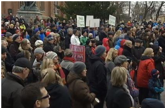
Klimatmanifestationen i Falun

Även i Gävle, Söderhamn och Skattungbyn hölls manifestationer.