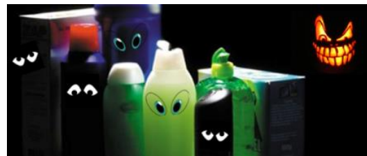
Bovarna i badrumsskåpet!

http://www.studieforamjandet.se/Kurs/stockholm/Riksupptakt-Schyssta-produkter-i-badrumssk%C3%A5pet/456105/