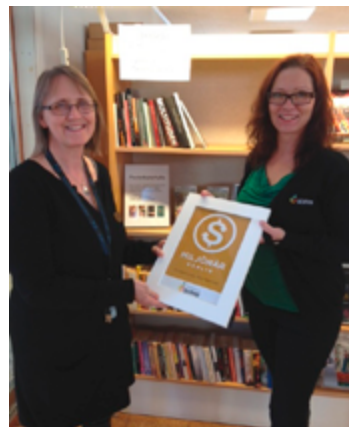
Bild från prisutdelningen