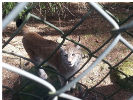
Lodjur på Järvzoo.